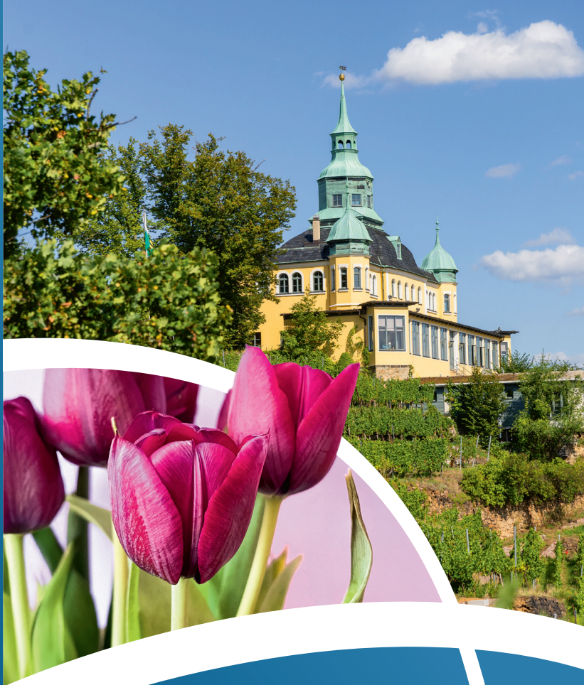
Teillfotos: Radebeul. | Tulpen: